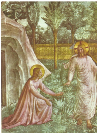
Jesus viser seg for Maria.

Mange fikk møte Jesus når han reiste rundt i landet, talte til dem og lærte hvordan menneskene bør være mot hverandre.