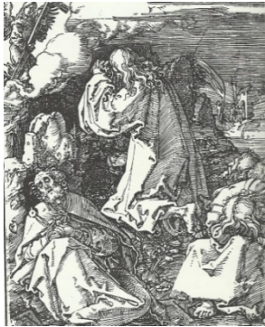
Jesus i Getsemane