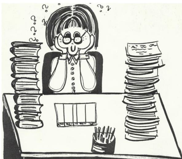
Tegning: Ruth Jensen